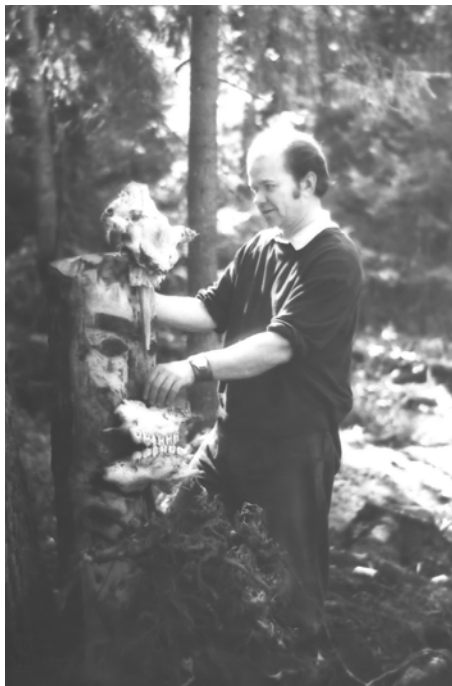
В Висимском заповеднике, 1970-е гг.