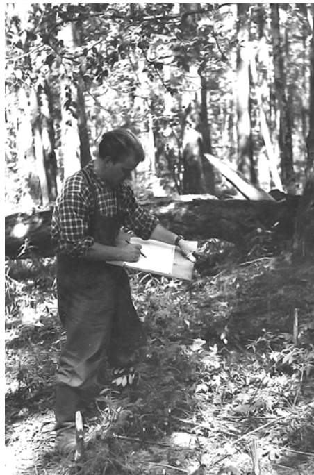
Работа на пробных площадях. Камчатка, 1959–1963 гг.