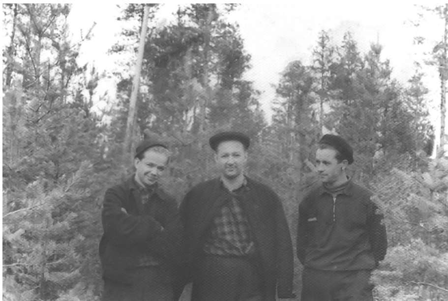
Камчатская комплексная экспедиция, 1959–1963 гг.