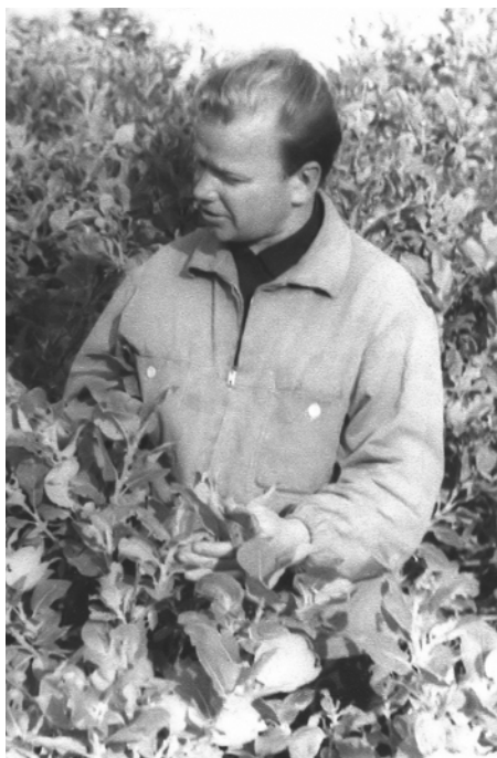
Во время работы в Вологодском педагогическом институте, середина 1960-х гг.