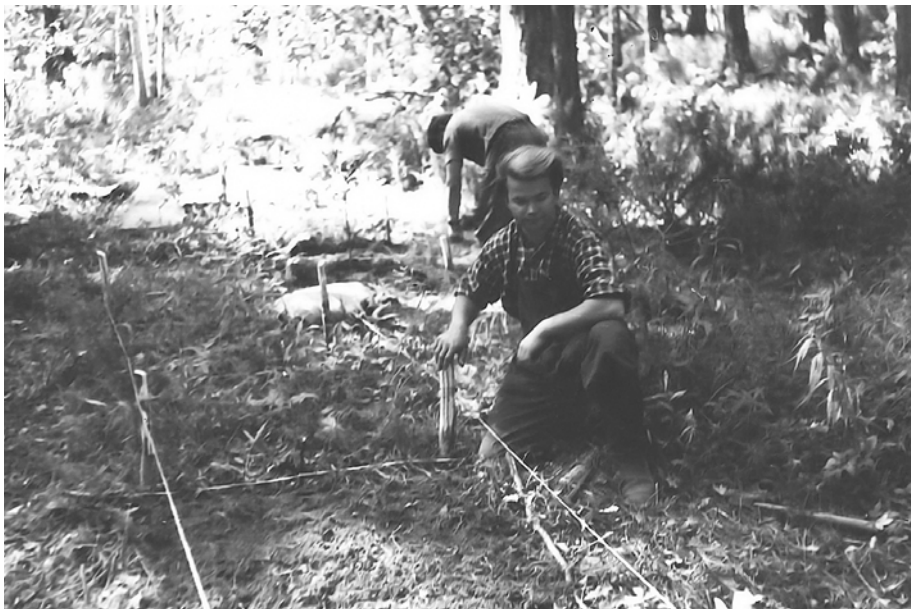
Работа на пробных площадях. Камчатка, 1959–1963 гг.