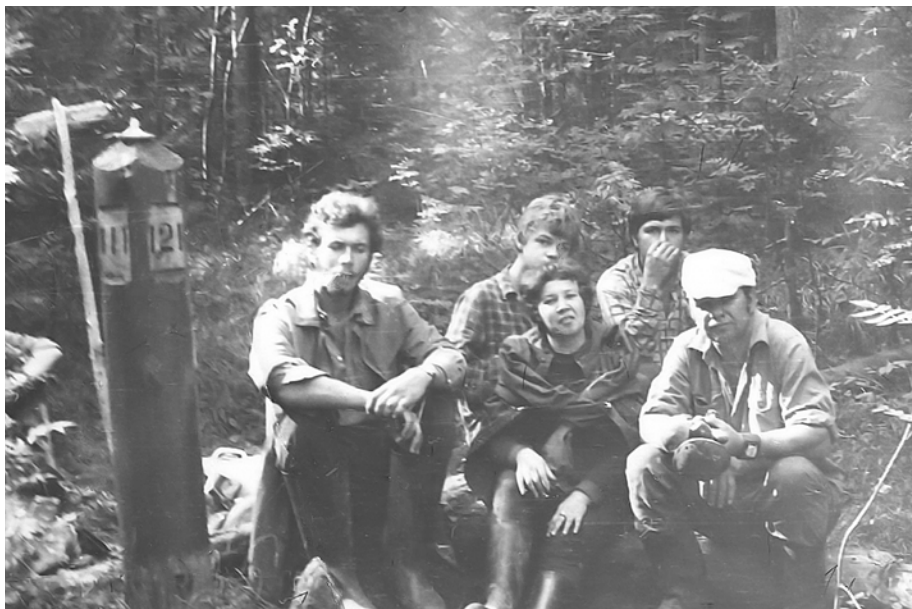
В Висимском заповеднике со студентами, первая половина 1970-х гг.